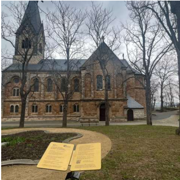
Euthanasiemahnmal vor der Lindenhofskirche

bekannt, weil hier die Evangelische Stiftung Neinstedt, ein bedeutender sozialdiakonischer Dienstleister beheimatet ist. Der Mitteldeutsche Rundfunk (MDR) hat die Stiftung in einer sehenswerten Reportage, die am 14.02.2023 ausgestrahlt wurde, unter dem Titel „Nächstenliebe und dunkle Schatten“ vorgestellt.