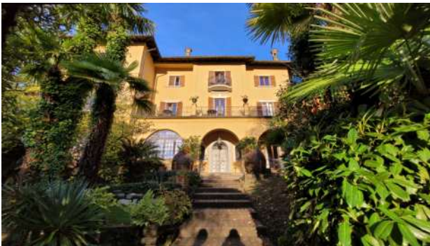
Die historische „Villa la Collina“ heute

Eine dieser unkonventionellen Vorgehensweisen war die Angewohnheit unseres ersten deutschen Bundeskanzlers, Konrad Adenauer, seine Sommerferien, teilweise bis zu acht Wochen, in einer Villa am italienischen Comer See – der Villa la Collina – zu verbringen und von hier aus, mittels Telefon und Telegramm, seine Amtsgeschäfte fortzuführen. Dieses „Ersatzkanzleramt“ am Comer See nutzte Adenauer in seiner Zeit als Bundeskanzler insgesamt 15-mal und die Amtsgeschäfte funktionierten damals über mehrere Wochen im Jahr auch knapp achthundert Kilometer von Bonn entfernt.