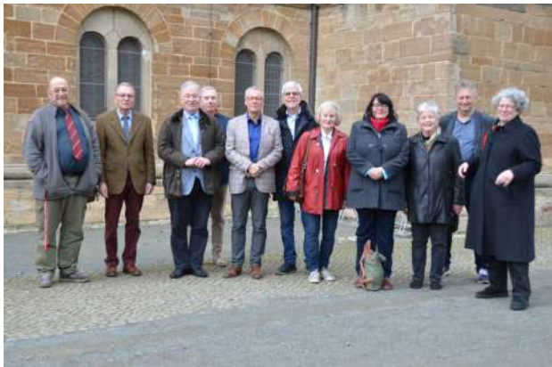
Mitglieder des EAK-Landesvorstandes vor der Lindenhofskirche

einbezogen. Es war anrührend, mit welchem Stolz ein junger Mann, der einen Wagen schob, uns auf seine Mitarbeit hinwies.