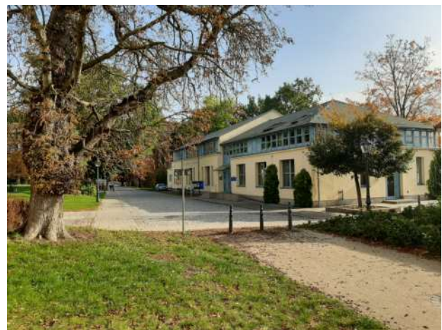
Gebäude der Ev. Akademie